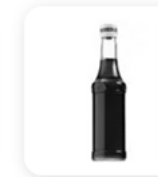
3 c.à.c de sirop de grenadine