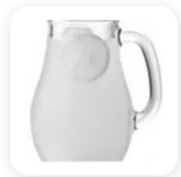
30 cl de jus de citron