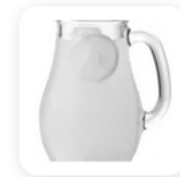
30 cl de jus de citron