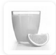
2 verres de jus d'orange