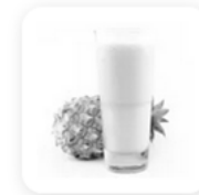
30 cl de jus d'ananas