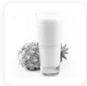
30 cl de jus d'ananas