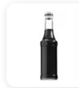
3 c.à.c de sirop de grenadine